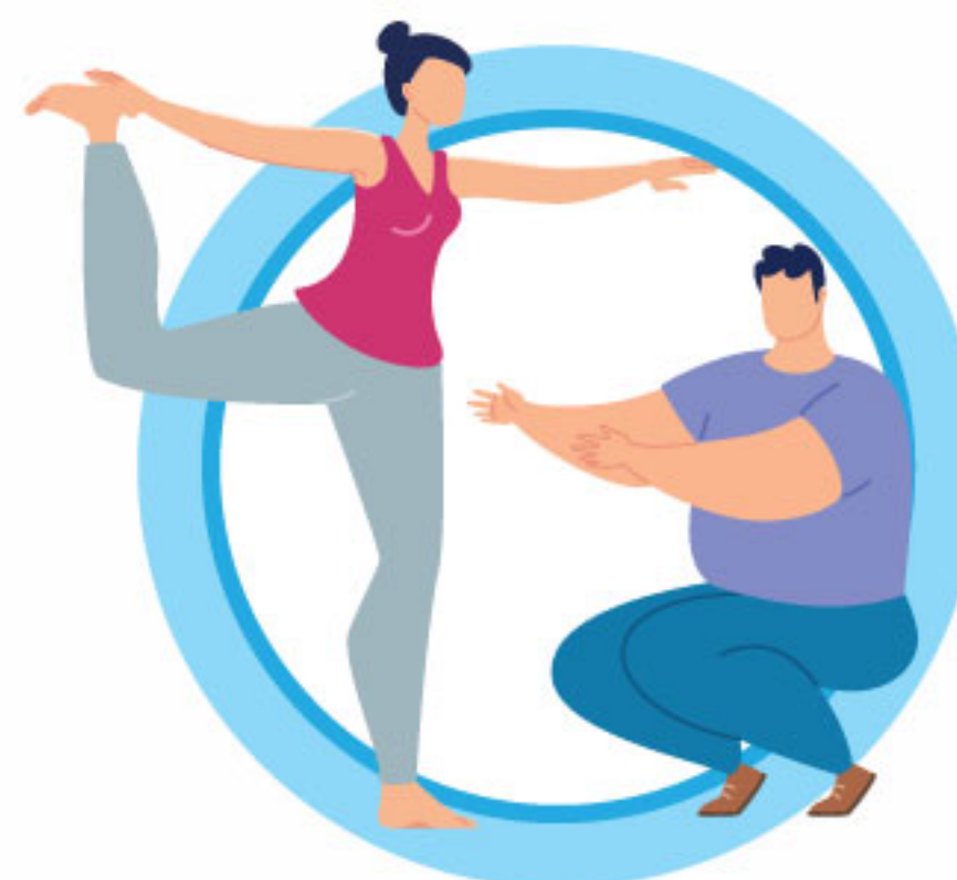
ВЕДИТЕ ЗДОРОВЫЙ ОБРАЗ ЖИЗНИ