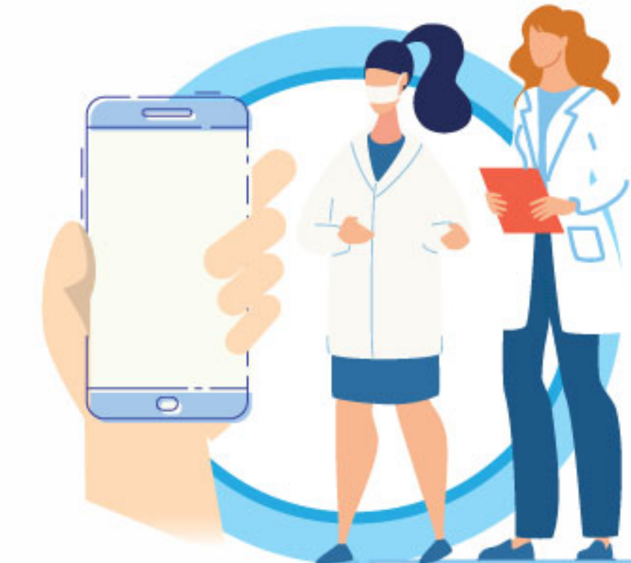
В СЛУЧАЕ ЗАБОЛЕВАНИЯ ОБРАЩАЙТЕСЬ К ВРАЧУ