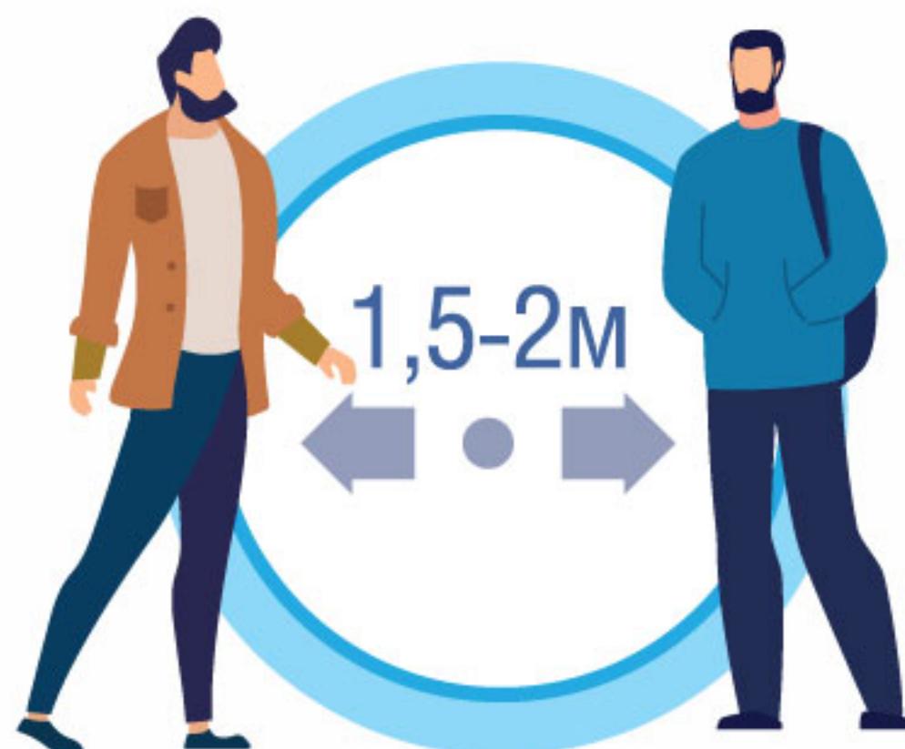
СОБЛЮДАЙТЕ РАССТОЯНИЕ И ЭТИКЕТ